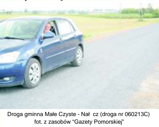
Droga gminna Małe Czyste - Nał cz (droga nr 060213C)

3)Wykonano przebudow drogi gminnej numer 060241C Kl czkowo – Sarnowo poprzez poło enie warstwy asfaltowej na odcinku 200 mb. Warto inwestycji to 52tys. zł.