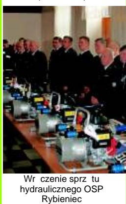
Wr czenie sprz tu hydraulicznego OSP Rybieniec