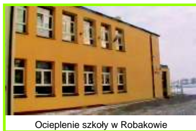
Ocieplenie szkoły w Robakowie