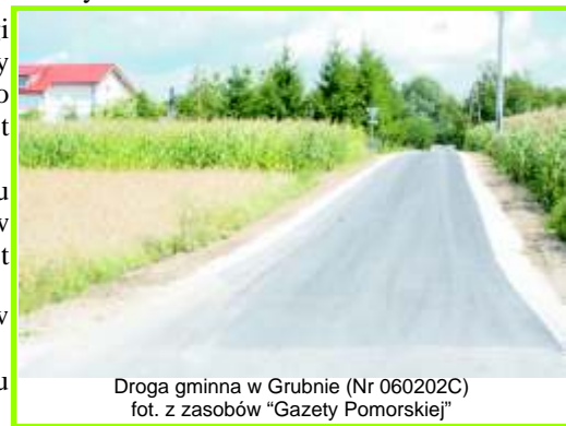
Droga gminna w Grubnie (Nr 060202C)