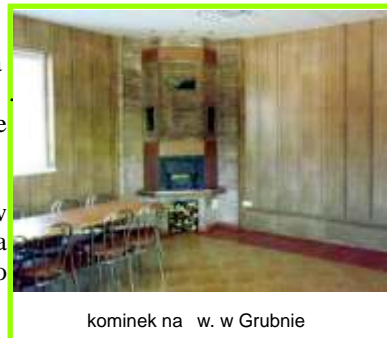
kominek na w. w Grubnie