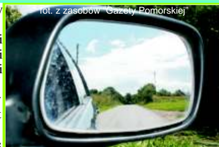
Droga powiatowa Rybieniec - Stolno (nr 1609C)

7) W dniu 15.10.b.r. odbyło si otwarcie ofert w ogłoszonym przetargu na rozbudow ZS Nr 1 w Stolnie – budowa Sali gimnastycznej. Do przetargu stan ło 14 firm. Oferty cenowe wahały si od 5.949.000 zł do 4.458.750 zł. Wygrała firma STAWBUD Krzysztof Stawski z Jedwabna (k. Lubicza) za cen ryczałtow 4.458.750 zł. Podpisanie umowy nast piło w dniu 29.10.b.r. Realizacja inwestycji zako czy si w lipcu 2014 r. 8) Budowa boiska wielofunkcyjnego w Robakowie za kwot 544 tys. zł.