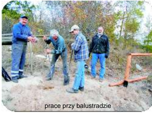
prace przy balustradzie