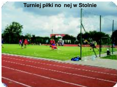
Turniej piłki nożnej w Stolnie