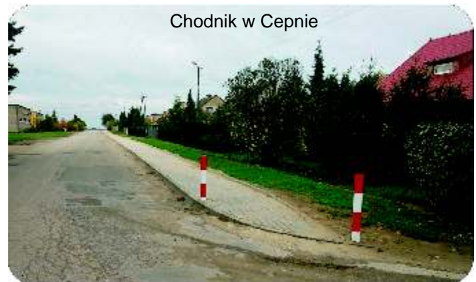
Chodnik w Cepnie