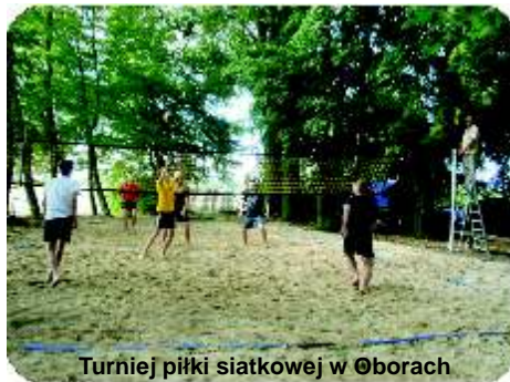
Turniej piłki siatkowej w Ceborach

W sierpniu odbył się turniej piłki siatkowej o puchar Przewodniczącej Rady Gminy Stolno oraz turniej piłki nożnej o Puchar Wójta Gminy Stolno. W pierwszym z nich brało udział 5 drużyn, trzecie miejsce zajęła drużyna Waliczek Team Stolno, drugie miejsce zajęła drużyna Stolno 2, I miejsce zdobyła drużyna z Rybnień, natomiast w turnieju piłki nożnej brało udział 10 drużyn, trzecie miejsce zdobyła drużyna ze Stolna, drugie miejsce zajęła drużyna z Wabcza, I miejsce zdobyła drużyna z Trzebiełuch-Zalesie.