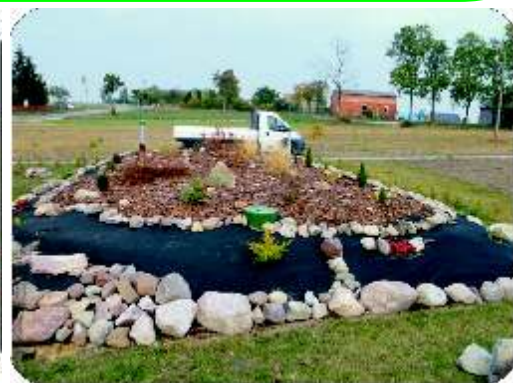
oczyszczalnia przydomowa oraz sposób zagospodarowania terenu