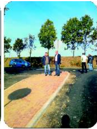
Droga Robakowo – Trzebiełuch

W miesi cu wrze niu rozpocz ł si remont uj cia wody w Małym Czystym. Inwestycja ta potrwa do ko ca listopada b.r. Dzi ki tej inwestycji ma poprawi si jako wody pobierana z tego wodoci gu. Inwestycja b dzie kosztowała gmin blisko 120 tys. zł.