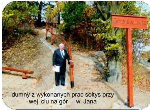
dumny z wykonanych prac sołtys przy wejściu na górę w Jana