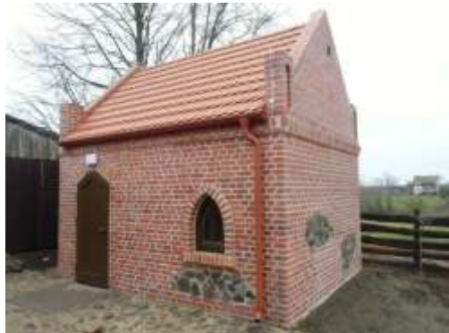
zaplecze socjalne przy ku ni w Oborach

5) Dostawa wyposa enia na wietlice wiejskie w miejscowoci Trzebiełuch, Obory oraz na boisko sportowe w Wabczu. Przetarg na t inwestycj został podzielony na 6 cz ci do której w formie przetargu przystąpiło a 16 firm. Wygrały cztery nast puj ce firmy : „DOMMAR” ,”PHPU ZUBER” , „CHEC-SPORT” , Agencja Muzyczna „ACCORD” , na kwot blisko 33tys. zł.