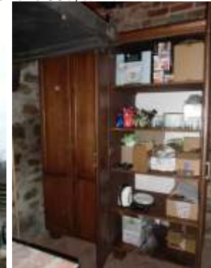
cz wyposa enia wietlic