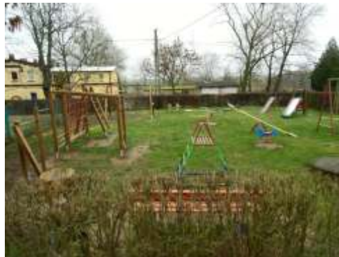
plac zabaw w Małym Czystym ( przy szkole)

2) Przebudowa dróg gminnych składająca się z czterech części : Trzebiełuch – Zalesie na odcinku 0,6km ; droga nr 060247 na odcinku 0,4 km w miejscowości Gorzuchowo ; droga nr 060218 C w Rybniecu; drogi w Paparzynie. Do przetargu przystąpiły 3 firmy, niekorzystniejszą ofertę złożyła firma „DROBUD” z Chełmy na kwotę ponad 650 tys. zł za wszystkie części.