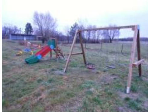
plac zabaw w Paparzynie