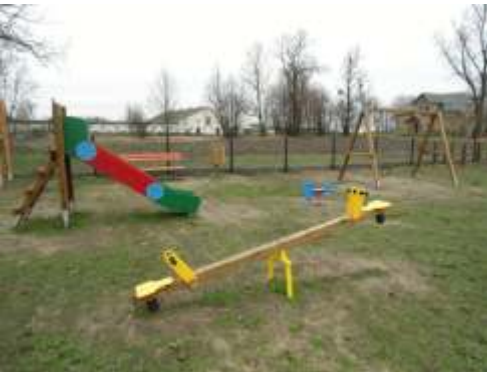
plac zabaw w Trzebiełuchach (zalesie)