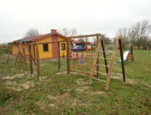
plac zabaw przy wietlicy w Trzebiełuchach

1) Dostawa wraz z montażem urządzeń zabawowych na pięciu placach zabaw w miejscowości Robakowo, Małe Czyste, Paparzyn oraz dwa place w Trzebiełuchach. Do przetargu na tę inwestycję stanęło 7 firm, a wygrała firma „MAGIC GARDEN” z miejscowości Pakoń, za kwotę blisko 60 tys. zł.