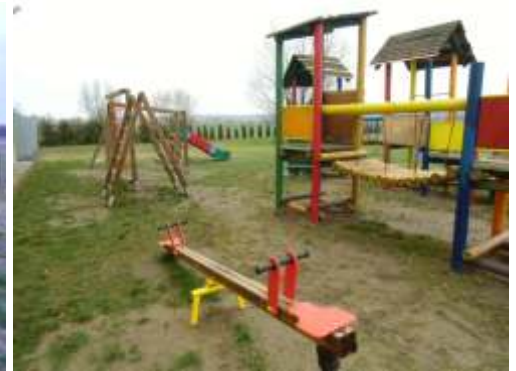
Plac zabaw w Robakowie ( przy szkole)