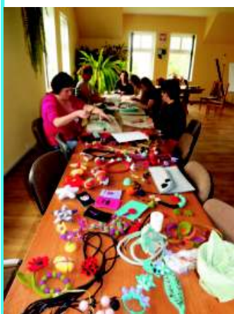
Filcowanie, Gm. Stolno