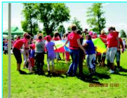
Zabawy w kolorach tarczy

Dnia 26 maja br. wytkowano w tym roku z powodu remontu boiska w Robakowie na boisku przy Zespole Szkół Nr 1 w Stolnie odbył się VIII Powiatowy Festyn ruchowo-rekreacyjny dla dzieci i młodzieży i niepełnosprawnej z okazji dnia dziecka zorganizowany przez Stowarzyszenie Inicjatywa Stolno oraz Urząd Gminy Stolno . Dobra współpraca z dyrektorami szkół i takież z pomocą pedagogicznym, sołtysami, radnymi i wolontariuszami owocuje łatwością i wydają współpracę w przygotowaniu imprezy na tak skalę (szkoły ułożyły materace, ławki i innych sprzętów potrzebnych w zorganizowaniu imprezy). Impreza współfinansowała