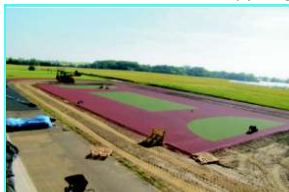
Boisko w trakcie remontu

Obiekt, którego przebudowa kosztowała będzie blisko 550 tys. złotych, realizowany jest dzięki współfinansowaniu z funduszy UE w ramach działania 413 „Wdrażanie Lokalnych Strategii Rozwoju” dla operacji, które odpowiadają warunkom przyznania pomocy w ramach działania „Odnowa i rozwój wsi” objętego PROW na lata 2007 – 2013 w odpowiedzi na konkurs ogłoszony przez LGD „Vistula – Terra Culmensis”. Ostateczne zakończenie inwestycji nastąpi do końca lipca b.r.