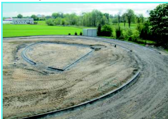
Miejsce do podicia kul